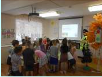
Играем в командах