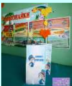
Уголки для родителей