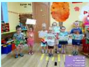
«Безопасное семейное автопутешествие»