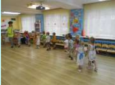
«В стране дорожных знаков»