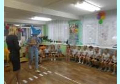
Незнайка в гостях у ребят