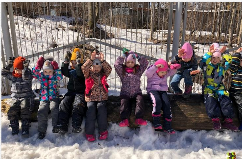
Спасаемся от наводнения