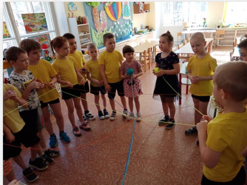
Игра «Паутинка» – называем качества воды и льда весной